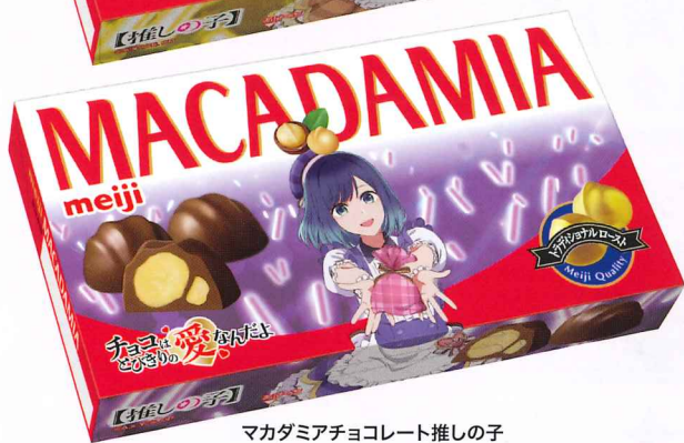
マカダミアチョコレート推しの子