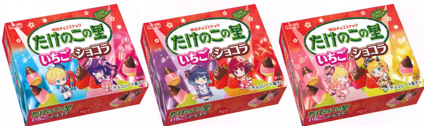
たけのこの里いちご&ショコラ推しの子

【推しの子】は、いま勢いのある日本アニメで、チョコレート菓子と初コラボ！ 第2期アニメの放映が決定！ 話題性抜群で国内外のお客様のあいだで人気沸騰中！