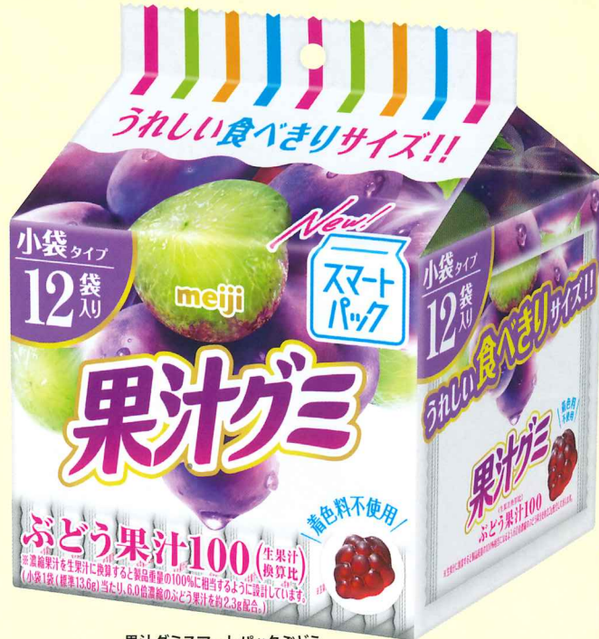
果汁グミスマートパックぶどう