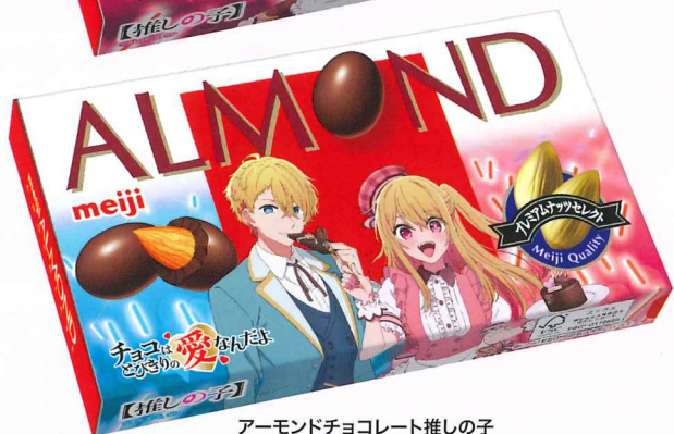
アーモンドチョコレート推しの子