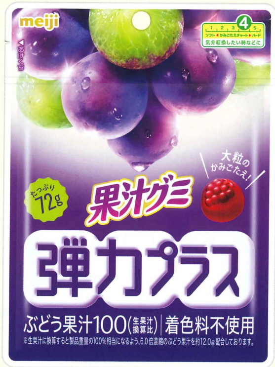
果汁グミ弾カプラスぶどう