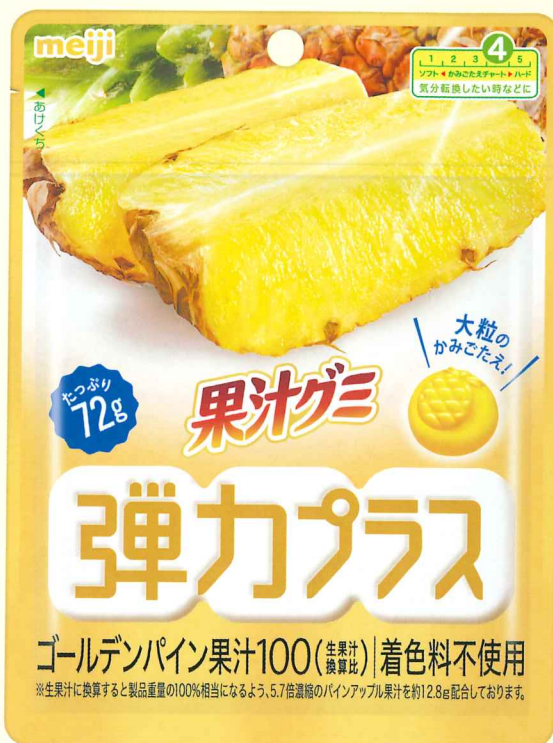
果汁グミ弾カプラスゴールデンパン