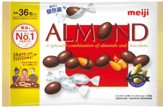
アーモンドチョコレートビッグパック