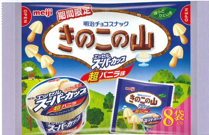
8袋きのこの山エッセルスーパーカップ超バナラ味