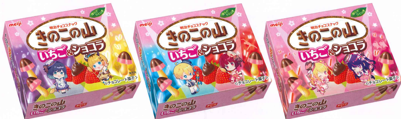
きのこの山いちご&ショコラ推しの子