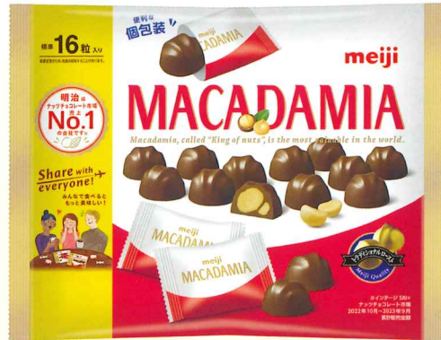
マカダミアチョコレートビッグパック