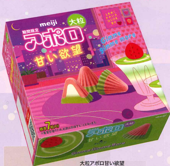
大粒アポロ甘い欲望